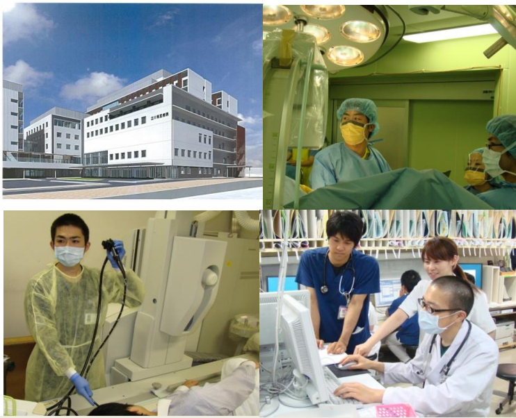
立川相互病院 後期研修説明会