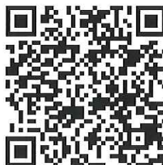
製品・サービス情報