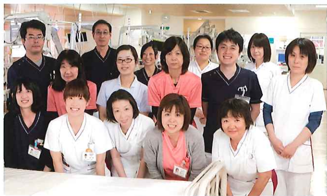
診療所のスタッフ