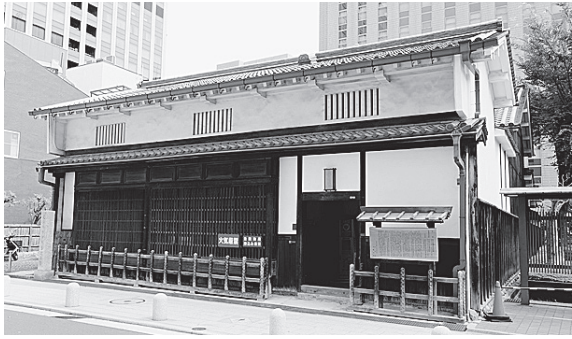
適塾 (緒方洪庵旧宅)