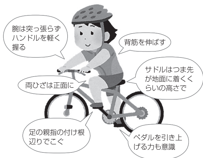
図 ダイエットにより効果のある乗り方

よりダイエット効果が高めたい方は、自転車のサドルを5センチ上げる、帰宅時だけギアを軽くする、電動自転車のアシストを切るなどの工夫で、消費カロリーを上