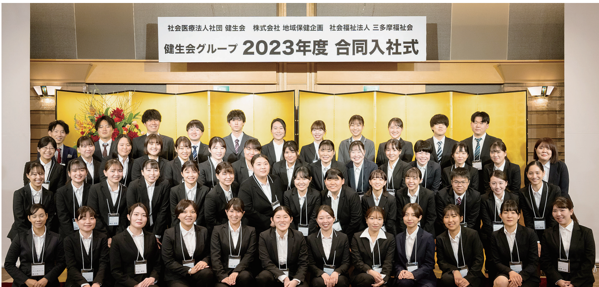
社会医療法人社団 健生会 株式会社 地域保健企画 社会福祉法人 三多摩福祉会 健生会グループ 2023年度 合同入社式