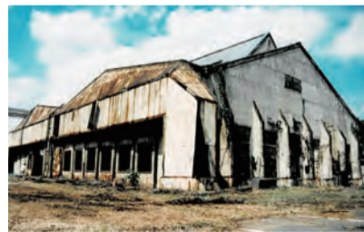
【写真1】取り壊し直前の頃の第五連隊飛行機工場(1995年)

▶昭和初期に、この周辺を撮影した写真があります(写真2)。モノレールをはさんだ現在の商業施設がならぶ一帯には、連隊の4つの格納庫が建っていました。