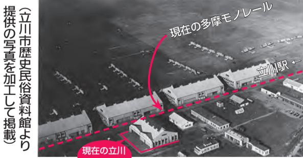
現在の立川相互病院