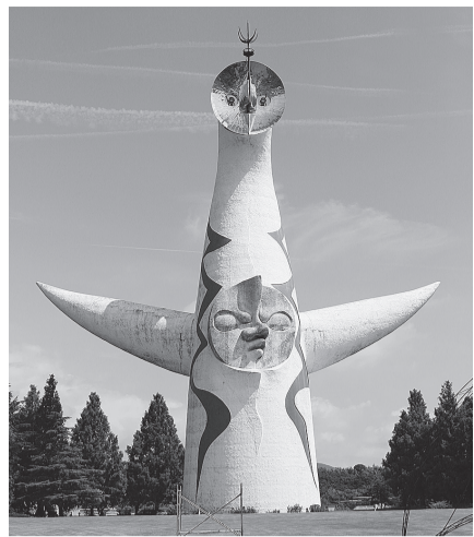
2025万博「ミャクミャク」の挿絵使用は、いやな腸の病気に感じてしかたがないうえ、ライセンスオフィスから「機運醸成へのご協力を提案いただいている中で恐縮ですが、」と断られてしまいました。

海外パビリオンの着工がおくれ、「災害」と思っ、超法規的に（建設労働者の）労働時間規制を撤廃