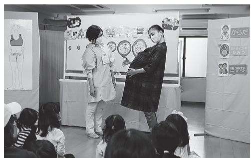
小さな子どもにも楽しんで理解してもらうために、パネルや小道具、「不思議な妊婦さん」の登場など、スタッフは手間をかけて講座を準備しています。

「性教育」をもっと広く捉え直す。からだの成長と共にかつていかにどう変化していくのか？いのちはどう誕生するのか？それらの知識が、自身の大切なからだへの肯定的なまなざしとなつてほしいと思つています。自分を大切にすることなく、他者を大切にすることはできません。それが、他者と平等な関係を築くこと、互いの人権を守ることにつながっていきます。