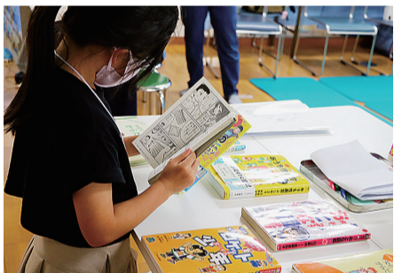
講座では、からだや性に関する子ども向けの書籍を紹介するコーナーも用意されました。

も気づいています。私たちは、10代の子どもたちに性教育の出前授業をしています。今はネットも発達していて、子どもたちはさまざまな情報に触れる機会が増えています。性に関することは、いやらしいこと・恥ずかしいことだから話題にしにくいという意識をすでに持っています。だから、まだ先入観が少ない幼児の時期に、男女のからだの違い、子どもが誕生する過程などを知る機会が必要だと考えるようになり