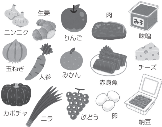
図 身体を温める食品

お風呂は湯船につかると、全身を温めるようにしましょう。ただし42℃以上の湯につかると交感神経が優位となつて血管が収縮し、