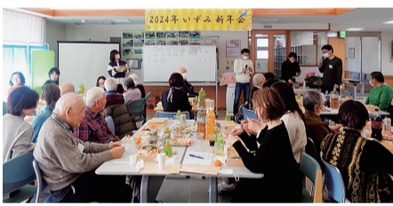
今年はピンゴゲームやカラオケなどを行いました

年は感染症対策を行いながら4年ぶりの開催となりました。この4年の間に新しい患者さんや職員も加わり、新たな体制となっています。ふだん顔を合わせるこ