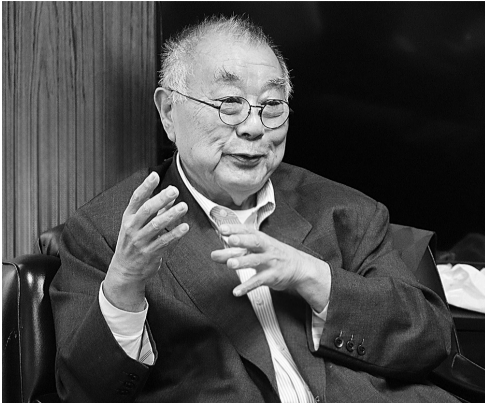
「福島の漁業の再生をめざす中で、船や道具などモノの災いは回復できるけれど、人という財産はあまりにもかけがえのない、大切な存在であることを痛感します」と野崎会長。