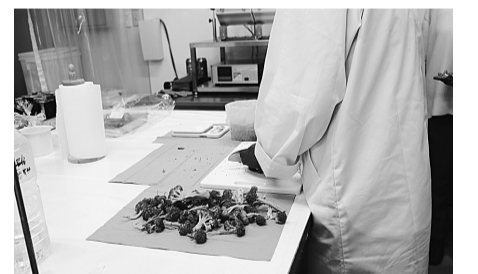
持ち込まれた野菜は細かく刻まれ、測定作業が始まります

いわき市小名浜港に近いビルにある、「いわき放射能市民測定室たらちね」。ここでは、地域の母親たちが中心となり、自ら食品・土壌の放射能測定を行っています。