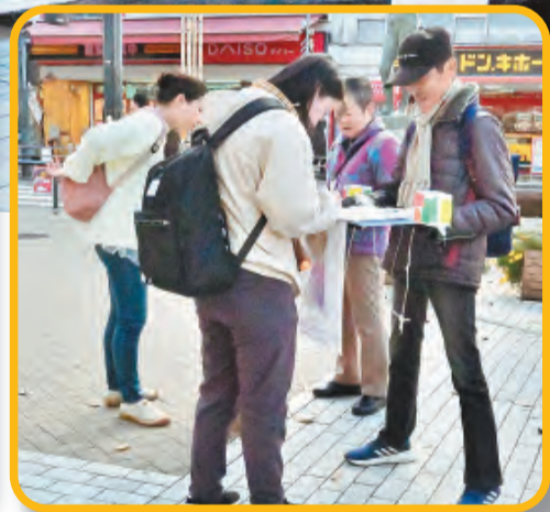
八王子原水協69 行動(2024年 12月6日)