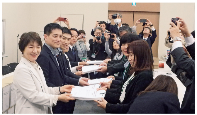
全国の民医連施設が集めた医療崩壊を食い止めるための約62万筆の署名を、4月8日に国会に提出しました。

また、アメリカとイランとの戦争で、石油製品である医療材料は品薄となり価格も高騰し、診療報酬プラス分の意味がなくなる事態となりつつあります。平和を守る活動は、皆さんのいのちを守る活動であるとともに、経営や社会保障を守る活動なんです。