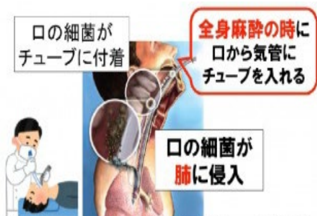
右図:「オーラルヘルスと全身の健康<2011年改訂版b>」P28図2を引用・加工 P&Gジャパン株式会社発行

全身麻酔手術では口からのどの奥を通して肺の近くまで呼吸をサポートするチューブを入れます。口の中が汚れていると大量の細菌が本来清潔でなければならない気管・肺の中に押し込まれ、肺炎のリスクが高まります。