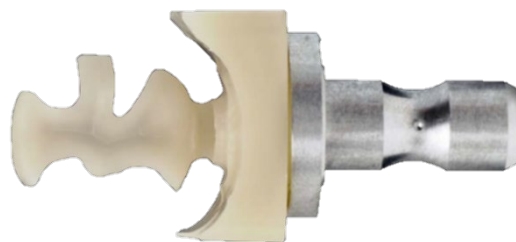
ブロックから削りだします