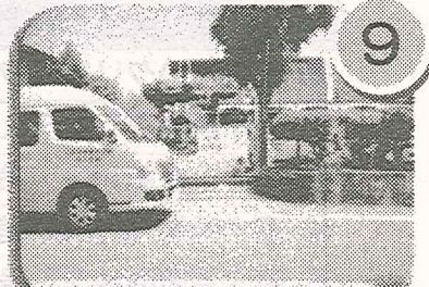
立川高校・グランド南側