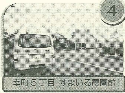
幸町5丁目 すまいる農園前