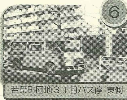
若葉町団地3丁目バス停 東側