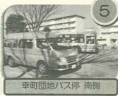
幸町団地バス停 南側