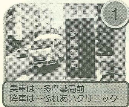
乗車は…多摩薬局前 降車は…ふれあいクリニック