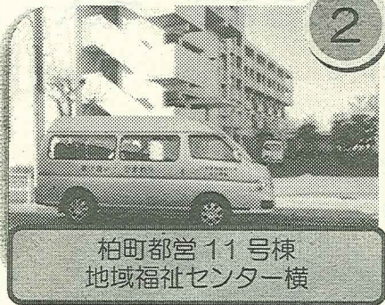
柏町都営 11号棟 地域福祉センター横