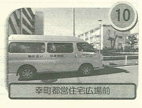
幸町都営住宅広場前