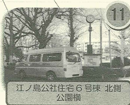
江ノ島公社住宅 6号棟 北側 公園横