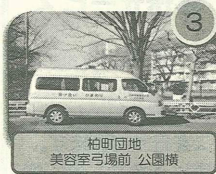
柏町団地 美容室弓場前 公園横