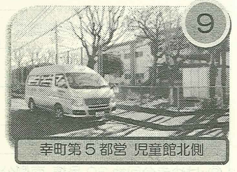
幸町第5都営 児童館北側