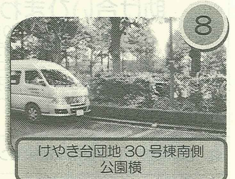
けやき台団地 30号棟南側 公園横