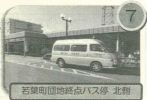
若葉町団地終点バス停 北側